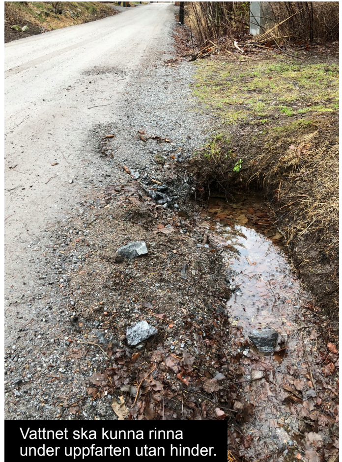
Vattnet ska kunna rinna under uppfarten utan hinder.