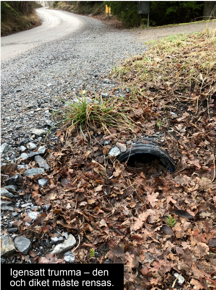
Igensatt trumma – den och diket måste rensas.